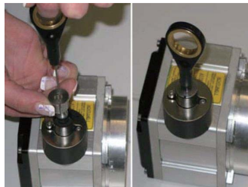
6. 通过在法兰内压入衬套来固定拉线锥型嘴