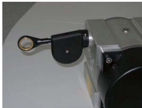
8. 最终状态: 安装导线滑轮后的拉线盒单元