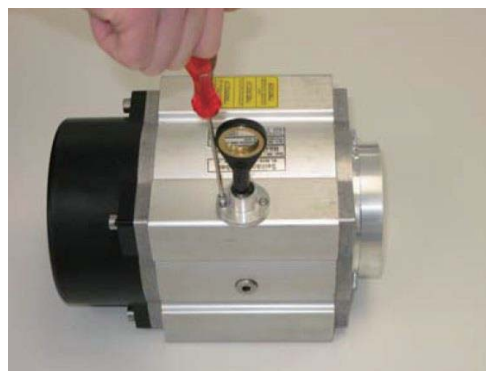
4. 拧紧导线滑轮的法兰