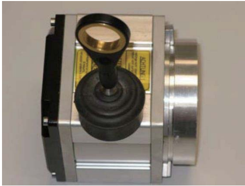
1. 初始状态: 带波纹管的拉线盒单元