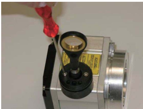
3. 拆下波纹管下面的法兰