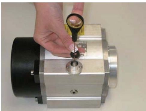
5. 用法兰内的橡胶圈固定拉线锥型嘴