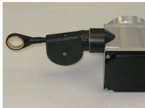
8. 最终状态: 安装导线滑轮后的拉线盒单元