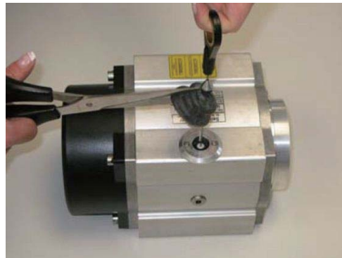
2. 剪开波纹管并将其取下