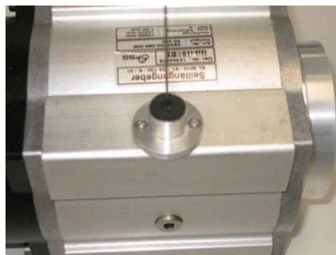
6. 将橡胶圈紧紧压在法兰上