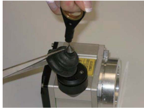
2. 剪开波纹管并将其取下