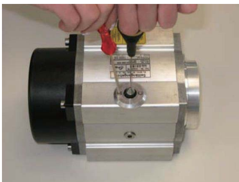
3. 拆下波纹管下面的法兰