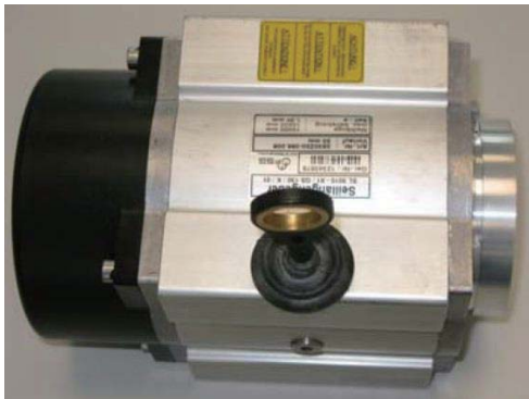
1. 初始状态: 带波纹管的拉线盒单元